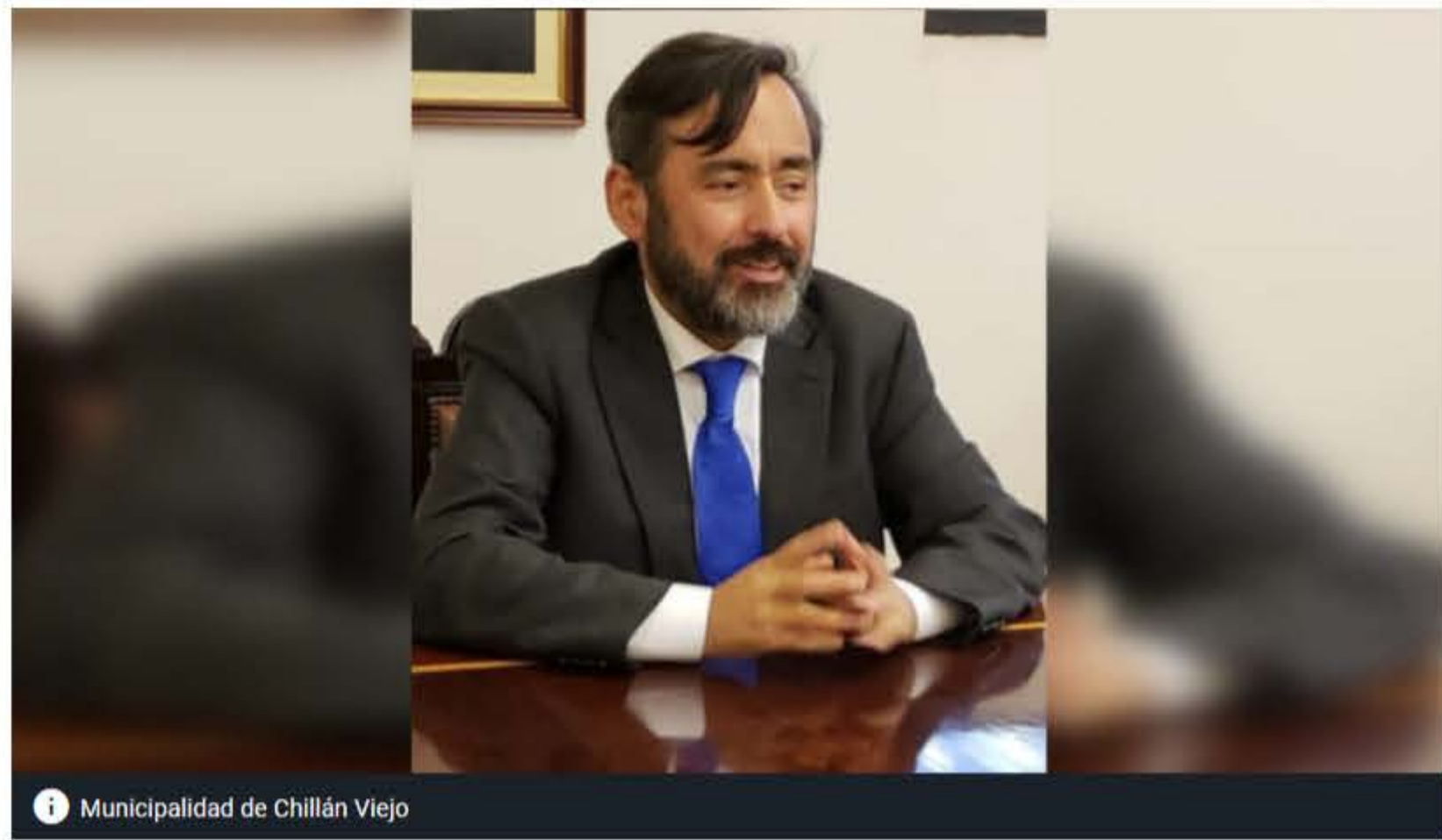
Municipalidad de Chillán Viejo