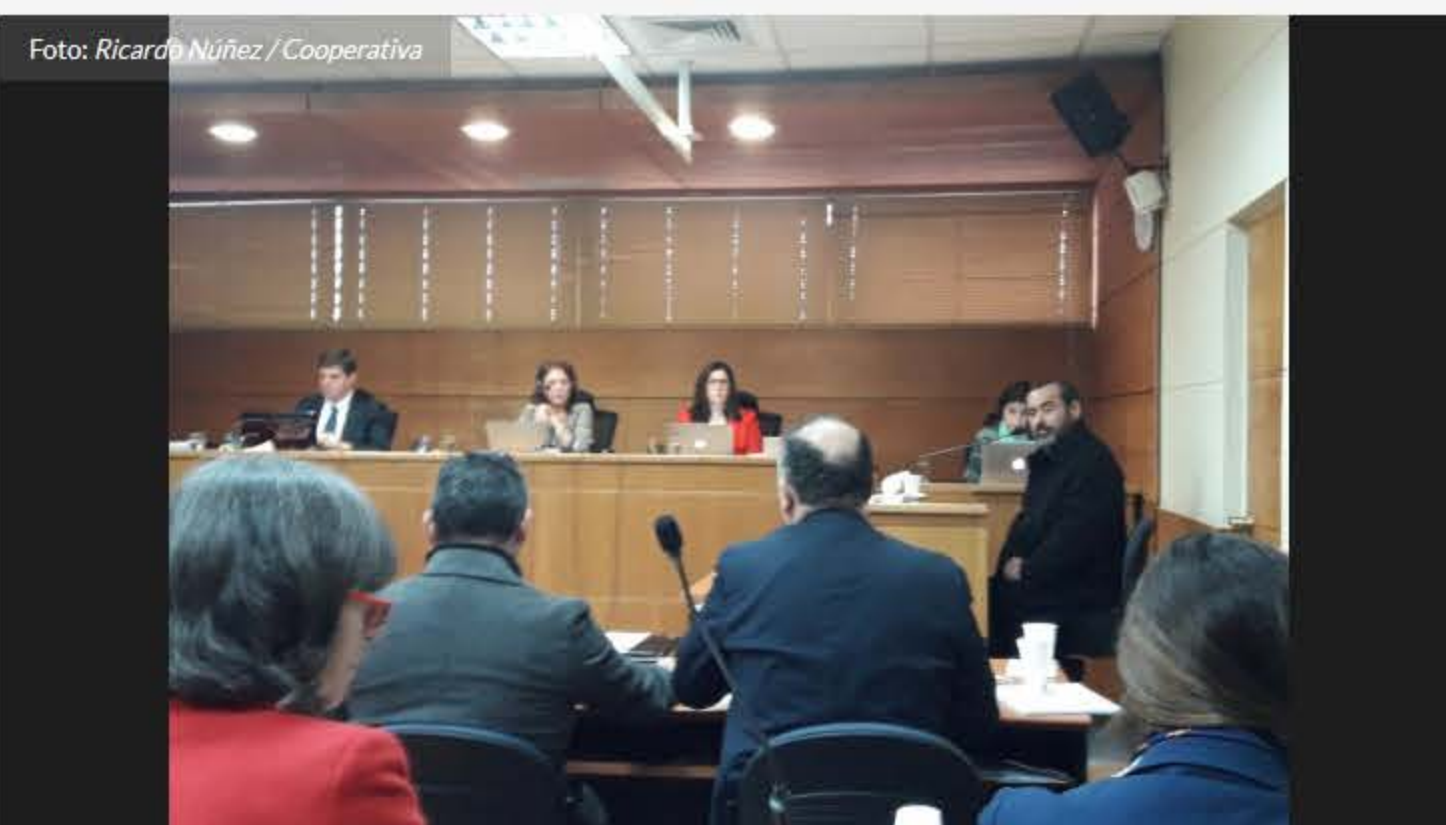
Foto: Ricardo Núñez / Cooperativa. Se trata de las costas más alta en Ñuble desde el inicio de la Reforma Procesal Penal.