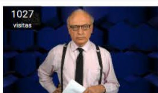
Nos fuimos al carajo: lo que viene