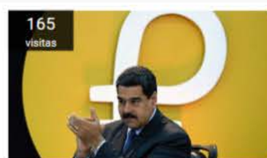
Petros: largas filas en Venezuela para comprar con bono en criptomoneda estatal tildada de "estafa"