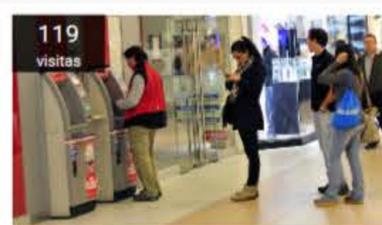
Clientes de cuenta corriente deberán decidir sobre pago automático de sus líneas de crédito