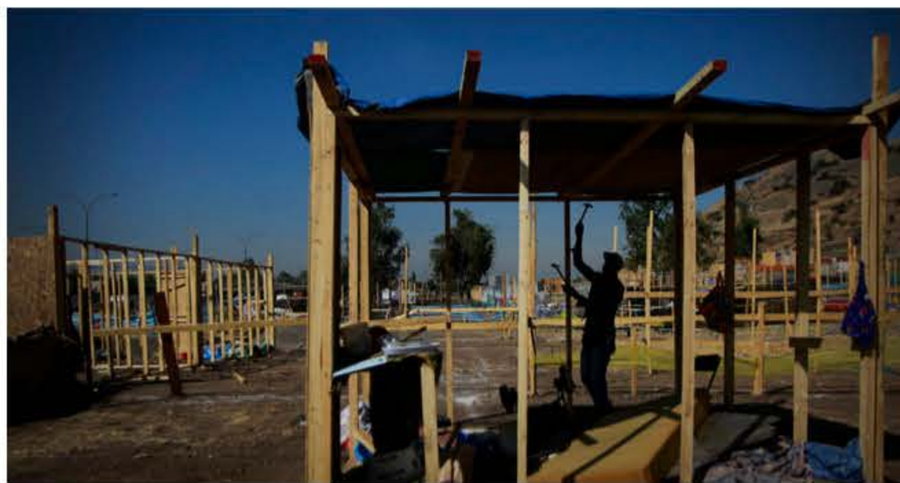
CONTEXTO | Agencia UNO

Publicado por Camila Mennickent La información es de Fabián Polanco